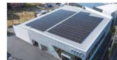
太陽光設備の設置

企業活動を行う上で欠かせないのが環境問題への配慮。持続可能な社会を実現するため、再生可能エネルギーの導入は企業にとって大きな課題となっています。サーラのゼロソーラーサービスは、そうした課題を叶える、発電した電気を自ら使用する自家消費型ソーラーサービスです。